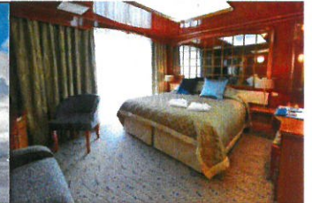
<ベランダスイート>